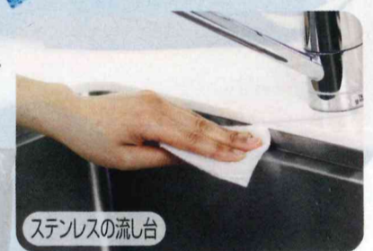
ステンレスの流し台

●材質：ポリエステル不織布、ゴムラテックス ●サイズ：(1枚)約17cm×24cm ●高級家具などの塗装物は塗料をとる恐れがありますので目立たない所でテストの上ご使用ください。★シンナーや揮発油などの溶剤と併用しないでください。★高温・高熱のものには使用しないでください。★サビやコゲなど化学変化した汚れは落ちません。★パッケージが変更になる場合がございます。