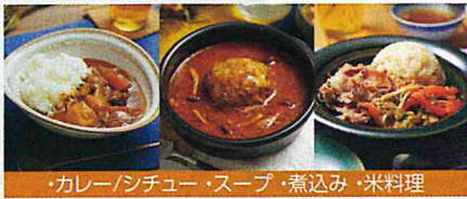
・カレー/シチュー・スープ・煮込み・米料理

材料を入れて作りたいレシピのコースを選ぶだけの自動調理。 火加減や、途中で材料を入れる必要が無いので、ほったらかし のおまかせ自動調理ができます。