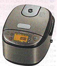
XT ステンレスブラウン